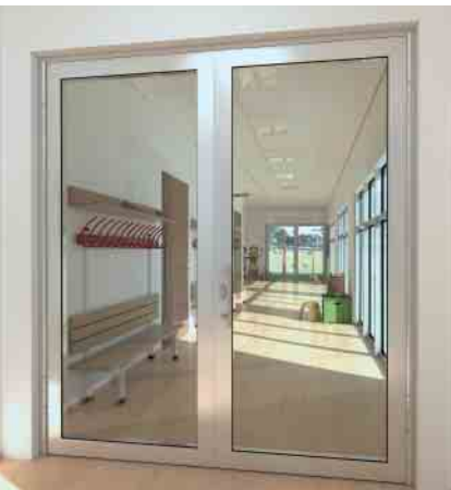
Klemmfreie Tür Anti-finger-trap door

The door and wall construction for multi-purpose applications. The series has been tested in accordance with European standards (EN 1364/1634) and German standards (DIN 4102) and meets the requirements of fire protection classes EI30 (T/F30) and EW30 (G30)